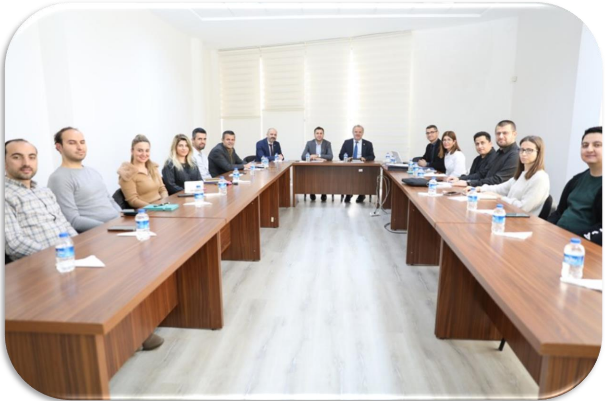
Stratejik Plan Hazırlık Toplantıları

Stratejik Plan Genelgesi ile başlayan hazırlık sürecinde; Strateji Geliştirme Kurulu ile 9 ve Stratejik Planlama Ekibi ile 10 toplantı gerçekleştirilerek 4 Amaç, 16 Hedef, 65 Göstergeden oluşan Stratejik Planımız 01.01.2025 tarihi itibarıyla web sayfamızda yayımlanarak yürürlüğe girmiştir. Üniversitemizin ikinci stratejik planı olarak hazırlanan bu stratejik planın değerlendirme tablolarına, 2025 Yılı İdare Faaliyet Raporu'ndan itibaren yer verilecektir.