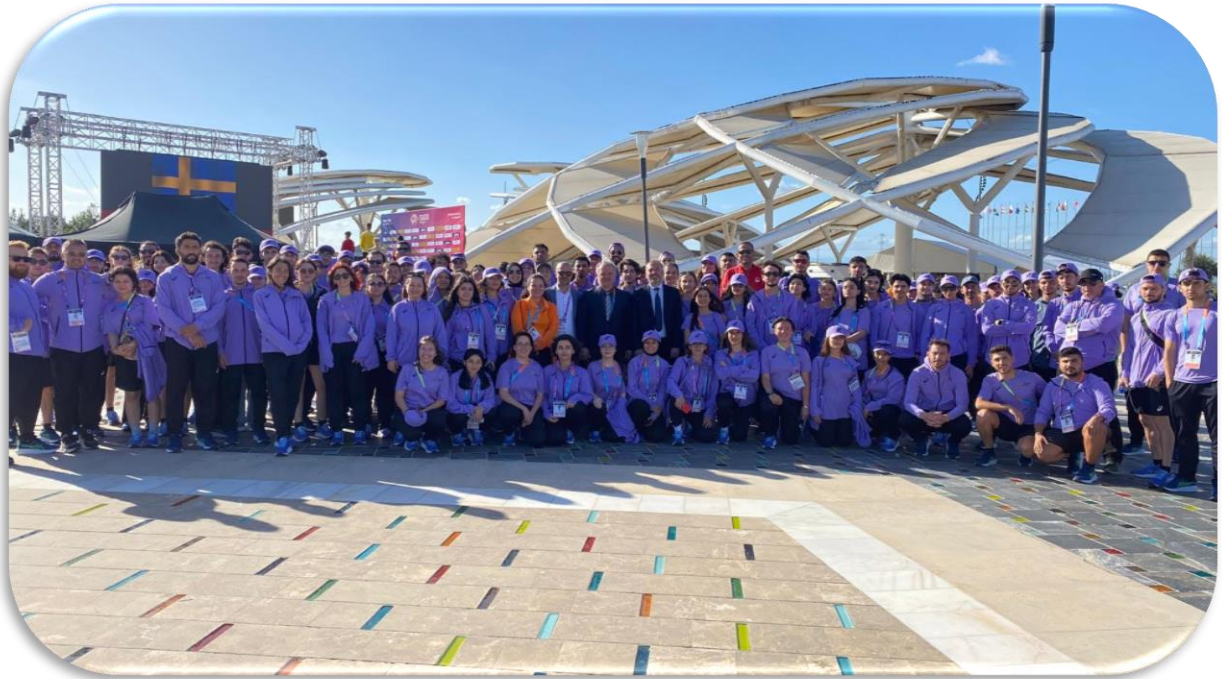
Dünya Atletizm Yürüyüş Takımlar Şampiyonası Ekibi