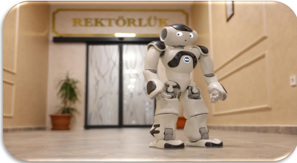
Tübitak Destekli Robot Projesi