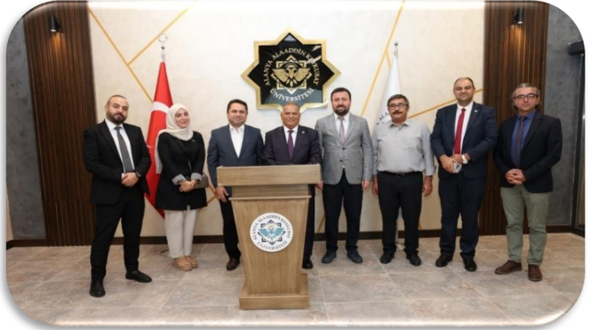
Uluslararası Üniversiteler ile Yapılan Anlaşmalar