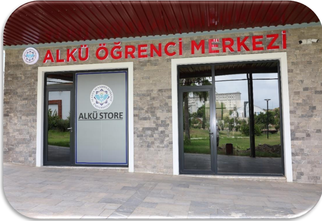
Alkü Store ve Öğrenci Merkezi